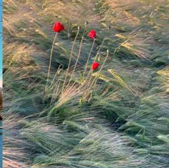
Gerlinde Orlowitsch | Kornfeld