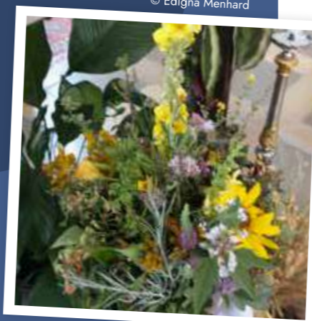
Ein Kräuterbuschen des Gartenbauvereins Rehling mit einer Vielfalt heimischer Heil- und Wildkräuter.