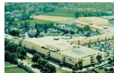
1980: erste Großfiliale in Friedberg

Bereits in den 1950er-Jahren erkannte man bei SEGMÜLLER die Vorteile des Direktverkaufs und eröffnete erste Verkaufsstellen in überwiegend süddeutschen Großstädten.