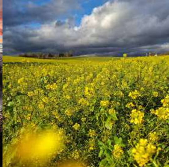
Beate Friedl | »goldenes Feld«