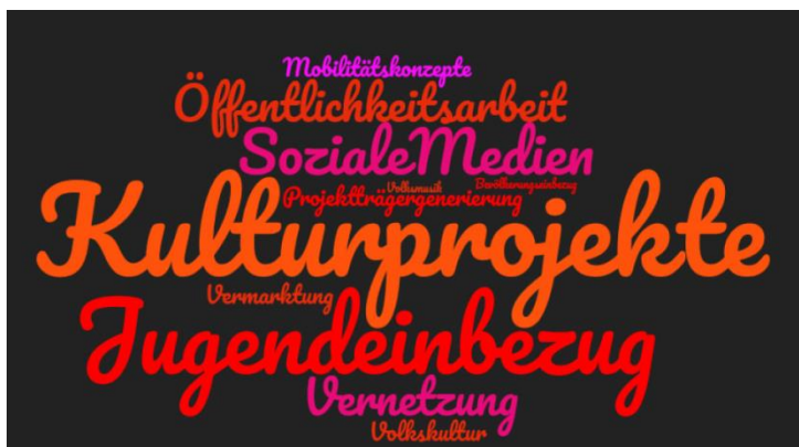
Abb. 1: Am häufigsten genannte Schwächen innerhalb der Handlungsziele

Um die Ergebnisse aus den Fragebögen und dem erläuterten Abgleich zu verbildlichen wurden zwei Wordle-Bilder ausgearbeitet, welche einerseits die am häufigsten genannten Schwächen in der Region (im Hinblick auf die LES) darstellen (vgl. Abb. 1), andererseits die gewünschte Priorisierung auf zukünftige Handlungsfelder (vgl. Abb. 2).