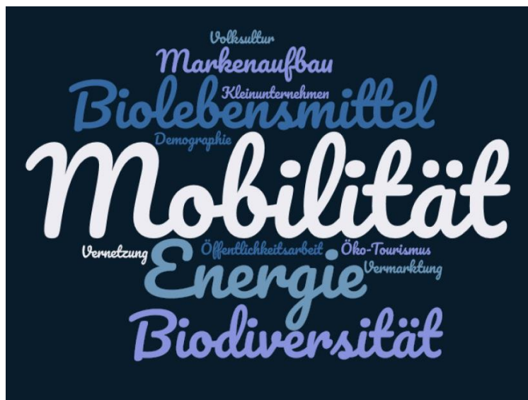
Abb. 2: Am häufigsten genannte Handlungsfelder, auf die man zukünftig besonderen Fokus legen sollte.